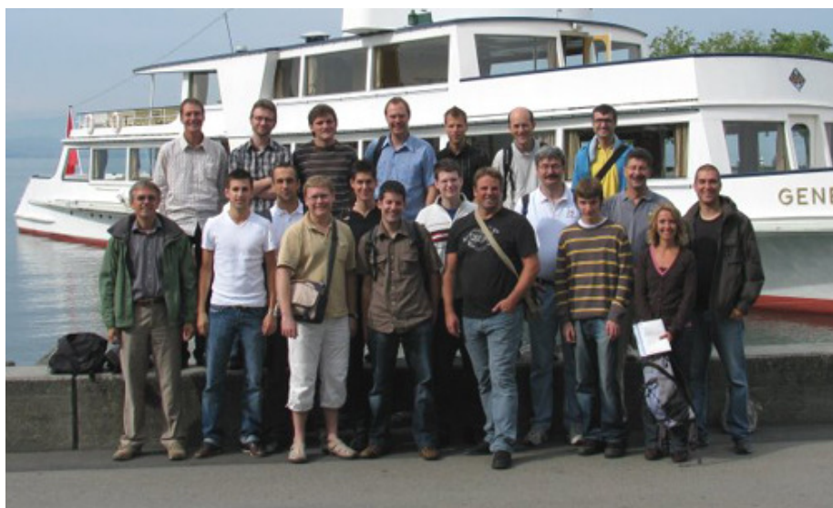
Das Team von Glue Software Engineering auf dem Firmenausflug 2008

Das breit abgestützte Portfolio von Dienstleistungen und Produkten erlaubt es Glue, bei der Umsetzung von Kundenlösungen aus einem grossen Fundus von Erfahrungen und erprobten Lösungen zu schöpfen. Auf der folgenden Seite finden Sie entsprechende Beispiele.