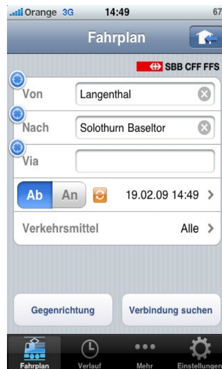
Der iPhone Fahrplan ist im App-Store gratis erhältlich.

Glue Software Engineering AG zeichnet im Auftrag des Bundesamtes für Justiz verantwortlich für die Architektur, die Realisierung und den Betrieb des Systems. Die Anwendung für den Betreuungsschalter nutzt eine weiterentwickelte Version des Frameworks http://www.open-egov.ch welches seine Leistungsfähigkeit und Flexibilität schon für das Portal www.kmuadmin.ch sowie das Bestellverfahren für Strafregisterauszüge unter Beweis gestellt hat.